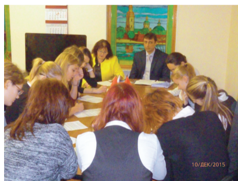
Круглый стол на тему «Конституционные основы местного самоуправления».

10 декабря в преддверии Дня Конституции проведен круглый стол на тему «Конституционные основы местного самоуправления» для учащихся старших классов образовательных учреждений округа. 28 декабря 2015 года на новогодних мероприятиях, проведенных в Куль-