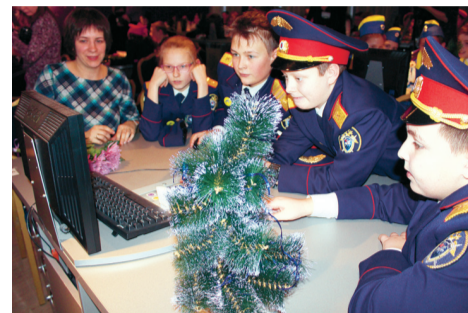
Команда школы № 304 отвечает на вопросы викторины «Фильм! Фильм! Фильм!»